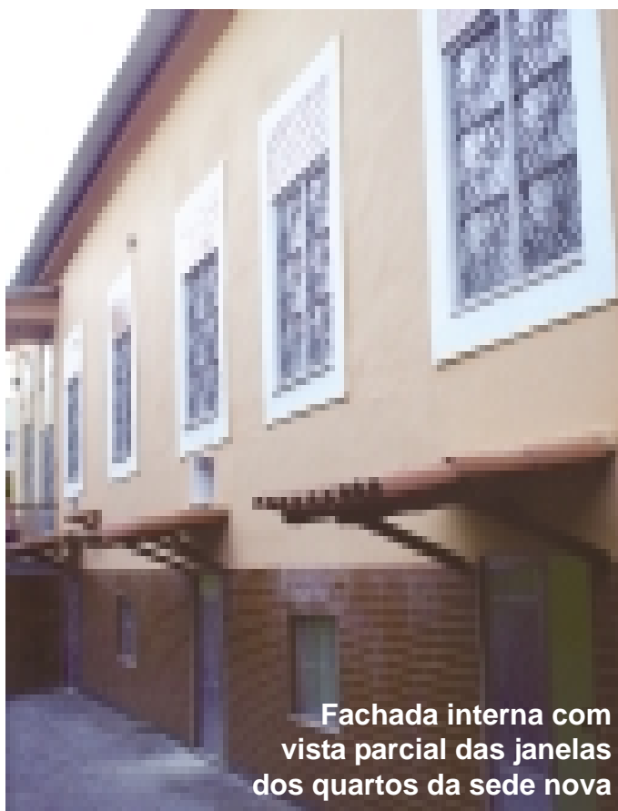
Fachada interna com vista parcial das janelas dos quartos da sede nova

Desde a fundação da entidade em novembro de 2000, o projeto acumula 84 crianças e famílias beneficiadas, oriundas de diversas cidades, tendo fornecido cerca de 1.250 hospedagens, incalculáveis transportes aos hospitais, distribuição de 4.032 cestas de apoio nutricional, 200 encaminhamentos para atendimento odontológico e psicológico, além de 48 encontros mensais para a realização de ações educativas com os responsáveis, entre outras ações realizadas pelo projeto. Com a Casa nova será possível aumentar e melhorar a qualidade do apoio dado as crianças e famílias, promover mais atividades culturais, artísticas e educativas, oficinas de fotografia, vídeo, teatro, pintura e confecção de produtos auto-sustentáveis (foco nas famílias), estimulando uma participação mais efetiva junto a