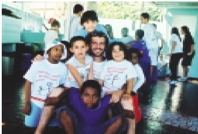
Voluntários e Crianças - momento de descontração na CACCST

DIVULGUE OS PROJETOS DA CACCST E SEJA MAIS UM VOLUNTÁRIO DAS NOSSAS CRIANÇAS! www.cacc.com.br