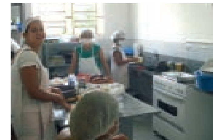
Mães do Núcleo de Apoio à Criança com Câncer do Estado da Paraíba fazendo pães artesanais para revender nas suas cidades e assim gerar renda